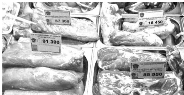
3 2 лістапада цэны памяншыліся.