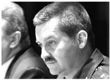
Рачкоўскаму прабачылі плюшавы дэсант.

выиграе першынствы свету. Знацьць, чалавек для спорту не чужы.