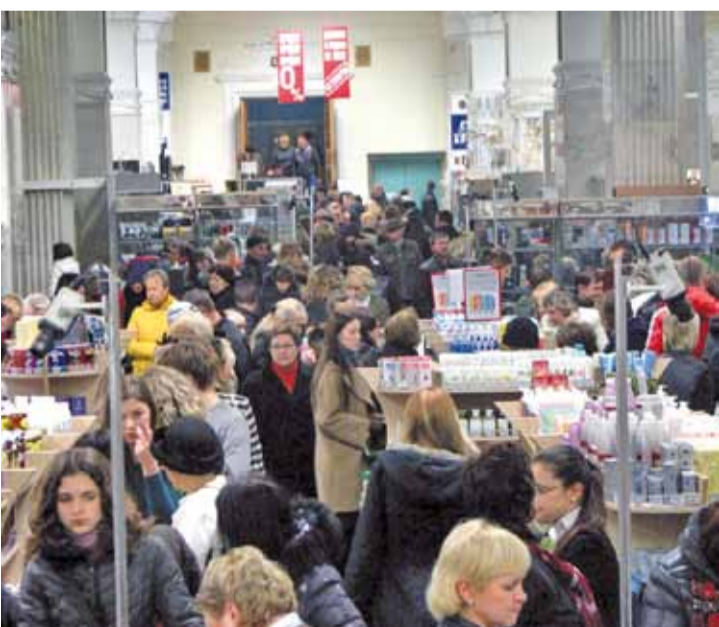
Вечарам 3 лістапада ў ГУМе прайшла «ноч зніжак». З 21:00 да 00:00 там дзейнічала зніжка ў 50%, але не на ўсю цану тавару, а толькі на нацэнку. І хоць сапраўдная зніжка складала 12%, рэкламны ход зрабіў сваю справу.