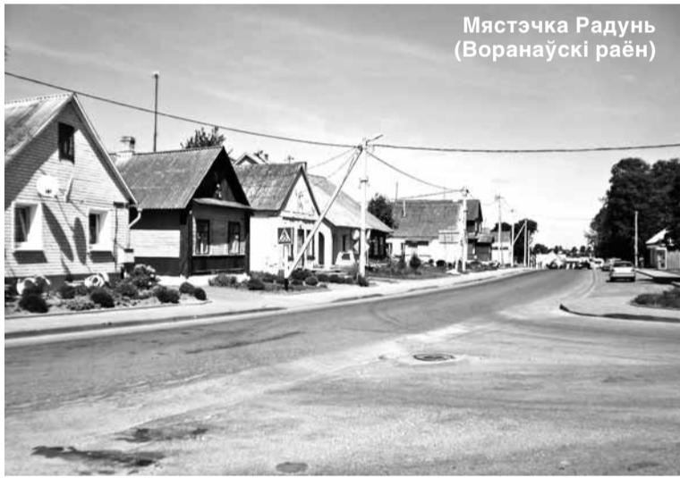
Мястэчка Радунь (Воранаўскі раён)