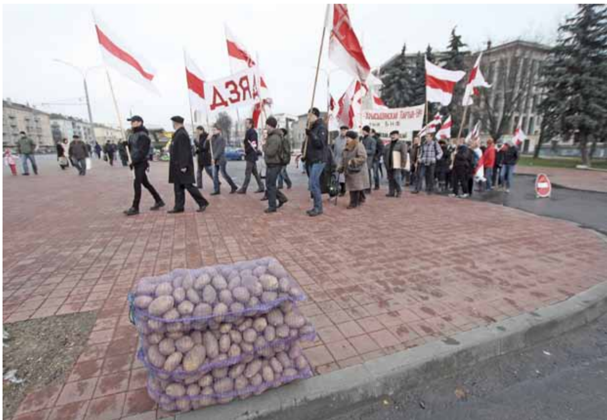
На жалобную акцыю КХП-БНФ у Лошыцы прыйшло 100 чалавек. Лошыцкі яр — урочышча, дзе органы НКУС у 1937—1941 гадах праводзілі масавыя расстрэлы. Колькасьць хвэяраў застаецца невядомай. У 1988 яр засыпалі, а на яго месцы збудавалі гаражны кааператыў.

*** Баязлівы Робін Гуд падглядваў за багатымі і расказваў пра іх бедным. *** Пазняк: У Беларусі няма сапраўднай апазіцыі. Сапраўдная апазіцыя: У Беларусі няма Пазняка. *** Ніколі нікому не кажы, што ўмееш пераўсталёўваць Windows. *** Усё што нас не забівае, робіць нас беларусамі. *** — Сынку, на вуліцы халодна — накінь што! — Абыякавы да падобных парадаў выраз твару, напрыклад? *** Калі бачу дзяўчыну, што перастараліся з касметыкай, адразу хочацца накрэмаць у іх на твары пальцам, як на аўто: «Памый мяне!» *** Зайшла дзяўчына ў краму. Прадавец, усміхаючыся, пытаецца: — Чаго дзяўчына хоча? — Дзяўчына хоча «Марціні», але прыйшла яна за хлебам... *** — Вы ведаеце, калі вас няма, пра вас такое кажуць... — Перадайце ім, што калі мяне няма, яны могуць мяне нават біць. *** — Я здрадзіла мужу. І ў дзень сваёй смерці я яму пра гэта раскажу. — А ты ведаеш дзень сваёй смерці? — Так. Гэта будзе дзень, калі я яму пра гэта раскажу.