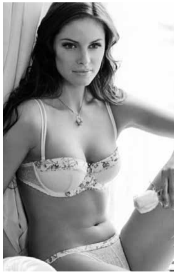
Беларускія прыгажуні заахвочваюць купляць бялізну ад «Мілавіцы» ў 500 крамах ва ўсёй Еўразіі.

Цяпер «Мілавіца» дасягнула штогадовага абароту 100 мільёнаў еўра і чыстага прыбытку 15 мільёнаў еўра. Прадукцыя кампаніі прадаецца ў 500 фірмовых крамах у 16 краінах свету.