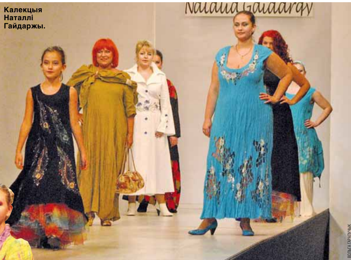
Калекцыя Наталлі Гайдарджы.