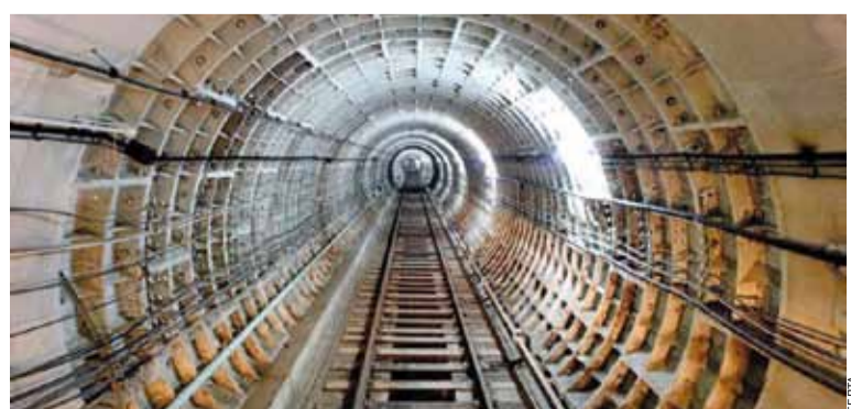
Новыя станцыі будавалі чатыры гады.

вёсак і фальваркаў, якія калісьці існавалі ў тых мясцінах.