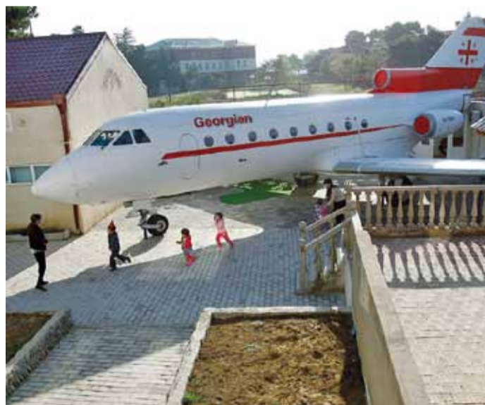
У адным з прыватных дзіцячых садоў Руставі (Грузія) усталявалі сапраўдны Як-40. Уладальнік саду Гары Чапідзэ набыў спісаны самалёт авіякампаніі Georgian Airways у Тбілісі і даставіў яго ў Руставі, дзе на працягу некалькіх месяцаў Як-40 адрэстаўравалі і зрабілі ў салоне пакой для гульні, пакінуўшы некранутай кабінку пілотаў.