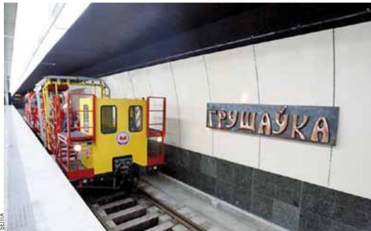
Грушаўка — так называлася вёска, якая размяшчалася на гэтым месцы раней.

раг перайменаванняў. Новыя назвы атрымалі 30 прыпынкаў грамадскага транспарту.