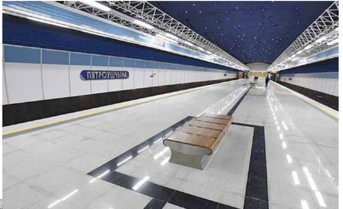
Асаблівасцю «Пятроўшчыны» стане змяненне зорнага неба над галавой.

Назваючы новыя станцыі метро, Мінгарвыканкам трымаўся прынятаму гістарызму. Грушаўка, Міхалова, Пятроўшчына — назвы