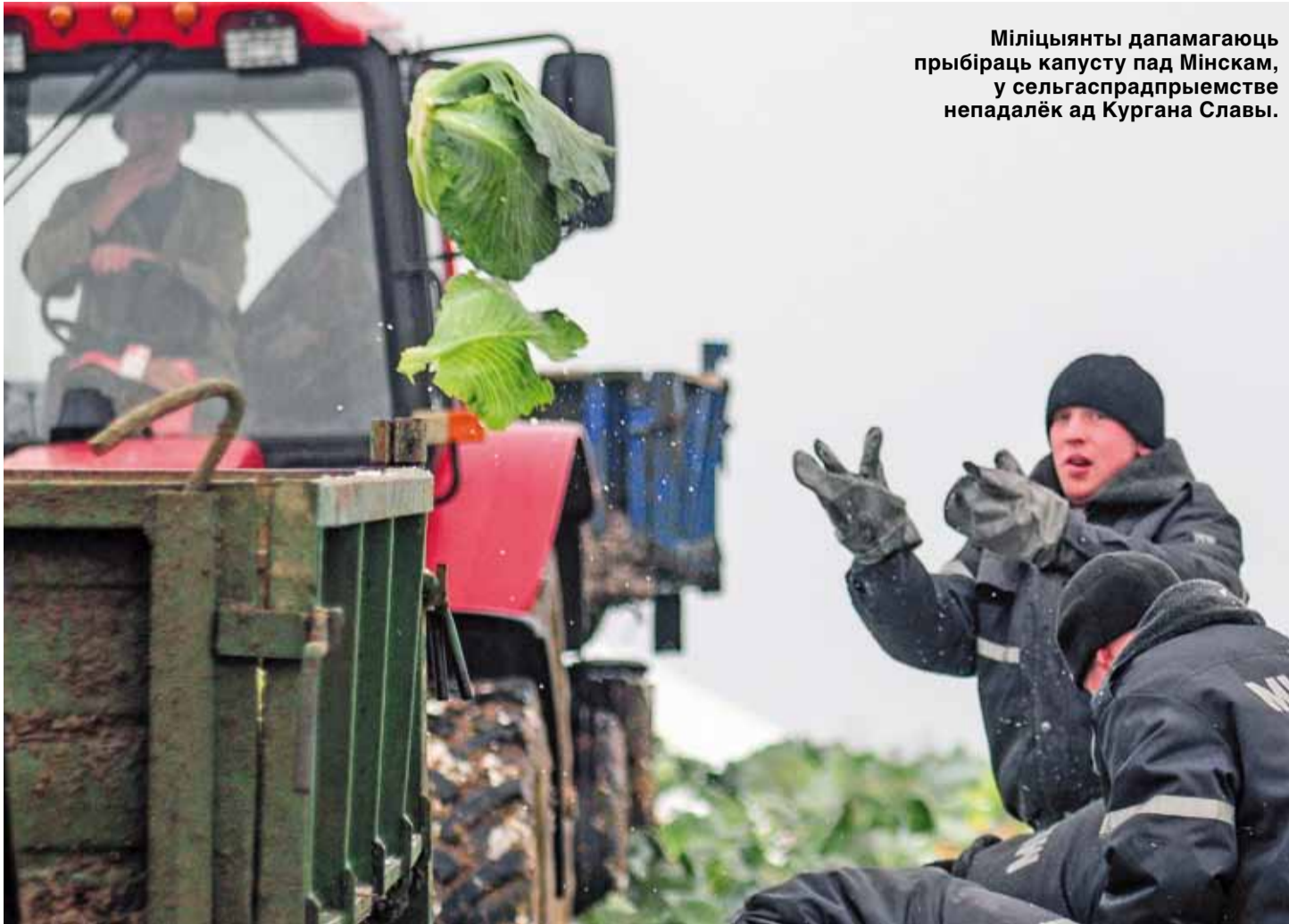
Міліцыянты дапамагаюць прыбіраць капусту пад Мінскам, у сельгаспрадпрыемстве непадалёк ад Кургана Славы.