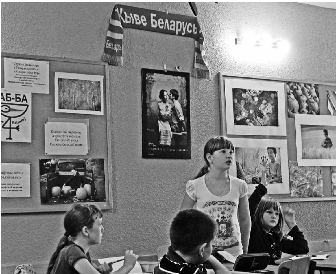
Урок беларускай мовы ў беластоцкай школе №4.